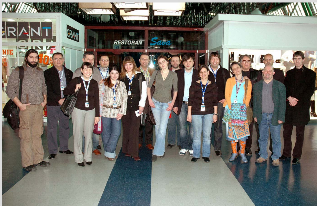
Učesnici projekta B2B

Svi zainteresovani novinari i snimatelji, koji žele večeras da prisustvuju ceremoniji zatvaranja, moći će da uđu u Veliku dvoranu Sava centra, sa Južnog ulaza, već od 19.15 sati.